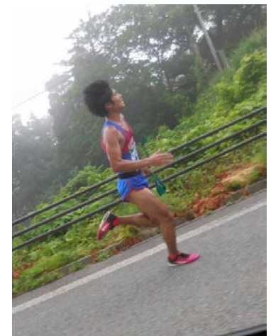
4区葛西(2年経営マネ)