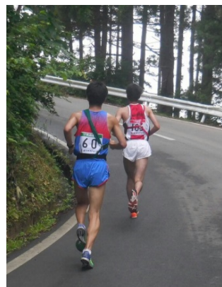
6区清本(1年アスリート)