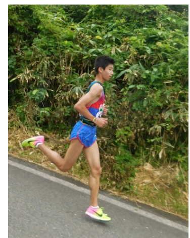
7区大橋(1年トレスポ経)