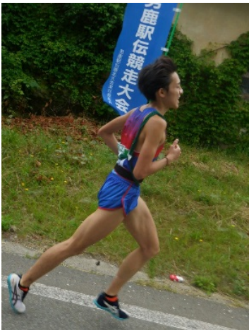
3区築嶋(2年臨床工学)